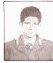
cap. A. FIUMARA