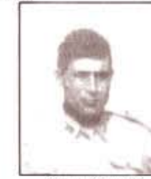
par. U. DE MITRI