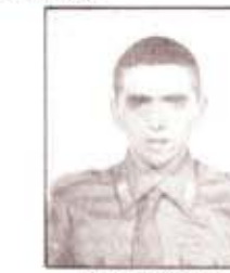
par. D. MARTELLI