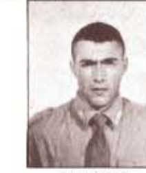
par. P. DESSI