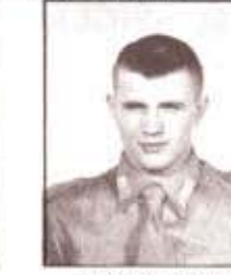
par. D. DAL ZOTTO