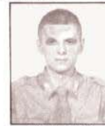
par. M. FERRARI