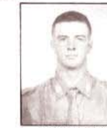
par. C. FRASSON