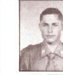
par. L. ANGELINI