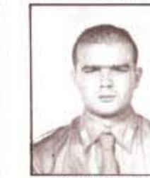
par. S. SABATINI