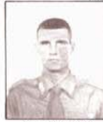
par. L. DAL LAGO