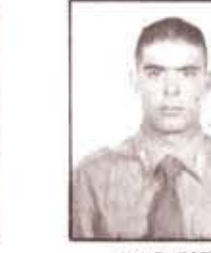
par. E. GARTA