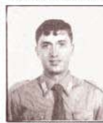
par. G. GIANNINI