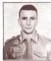
par. G. GUARNIERI