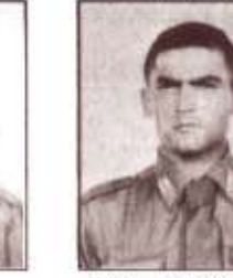
par. A. D'ALESSANDRO