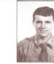
par. W. FURGERI