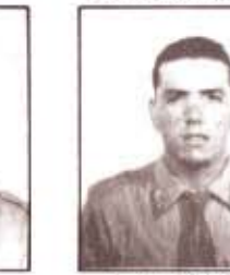
par. L. TORSELLO