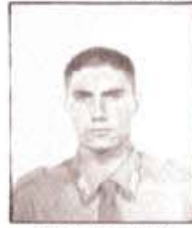
par. V. DE MARCO