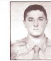
par. R. MORGANTI