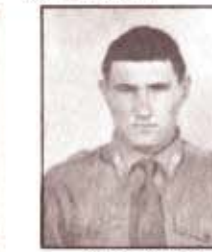
par. E. QUARTI