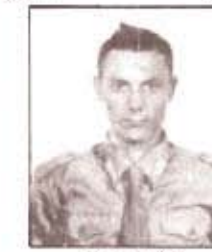
par. R. LUZZI