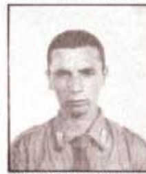
par. G. D'ALESSANDRO