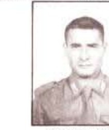
par. S. FUMOSA