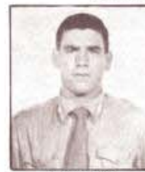
par. A. GINEX