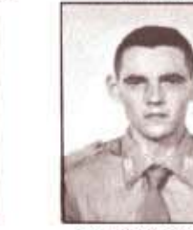
par. R. FRACASSETTI