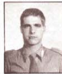
par. G. DI NATALE