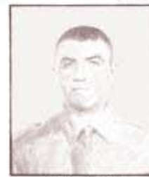
par. A. GILIOLI