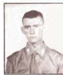
par. B. GUIDORZI