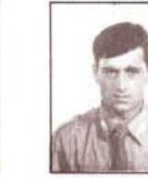
par. R. GIANNATTASIO