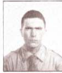
par. A. DEIANA