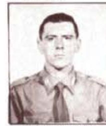
par. F. DALL'ASTA